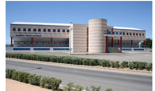
Polideportivo Municipal, Llerena