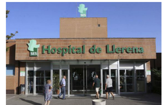
Hospital de Llerena