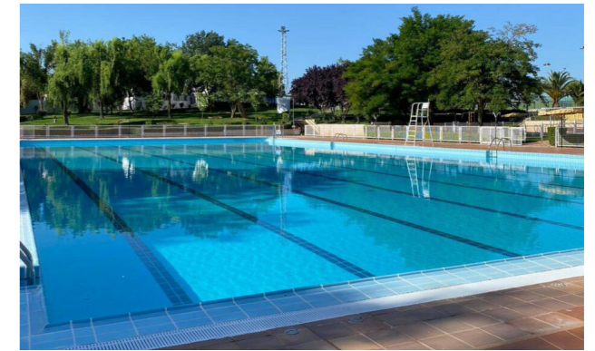
Biblioteca Municipal, Llerena