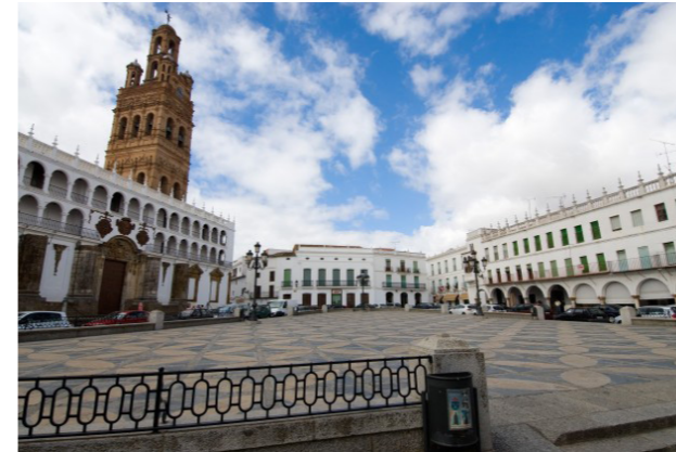
Plaza de España, Llerena

Premio Reina Sofía Contra las Drogas 2009 en la categoría de mejor labor social. “Certificado de Calidad en el Modelo de las Estrellas” Declarada de Utilidad Pública. BOE 218 /9-09-16