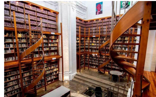
Biblioteca Municipal, Llerena